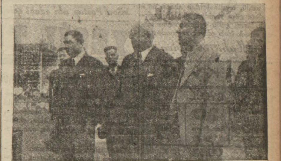
Başvekil İzmir fuarında

Nazilli 19 (Hususi) — Başvekil doktor Refik Saydam dün Nazillide gelmiş, parlak bir surette karşılanmıştır. Halkı bahçesine giden Başvekilimiz orada halkla konuşmuş, basma fabrikasını tetkik etmiş, şere-